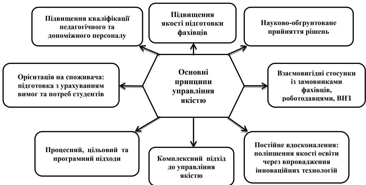
Рисунок 1 – Основні принципи управління якістю освітньої діяльності у коледжі

Внутрішня система забезпечення якості освіти у коледжі, крім моніторингу багатьох кількісних показників, спрямована на підтримку системи цінностей, традицій, норм, які визначають ефективність функціонування навчального закладу. Система управління якістю освіти у коледжі базується на системі управління якістю освіти в університеті, є її складовою та побудована за принципами, зображеними на рисунку 1.